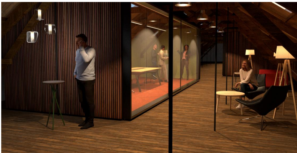
Illustrasjon hentet fra mulighetsstudien som viser mulig bruk av loftet til møterom/lounge el.