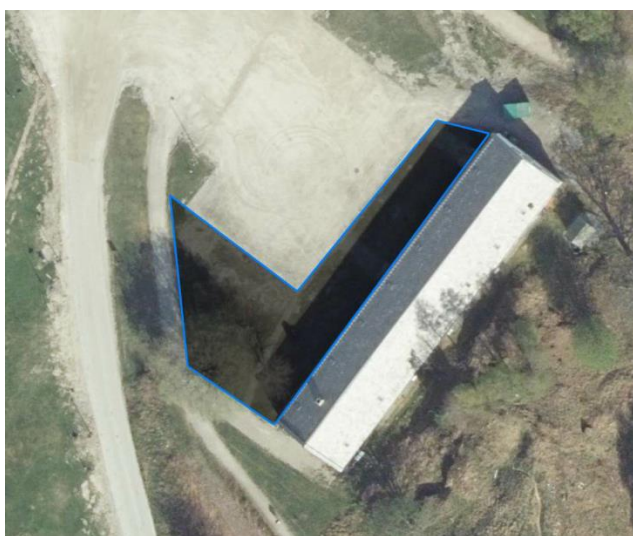
Areal for mulig uteservering