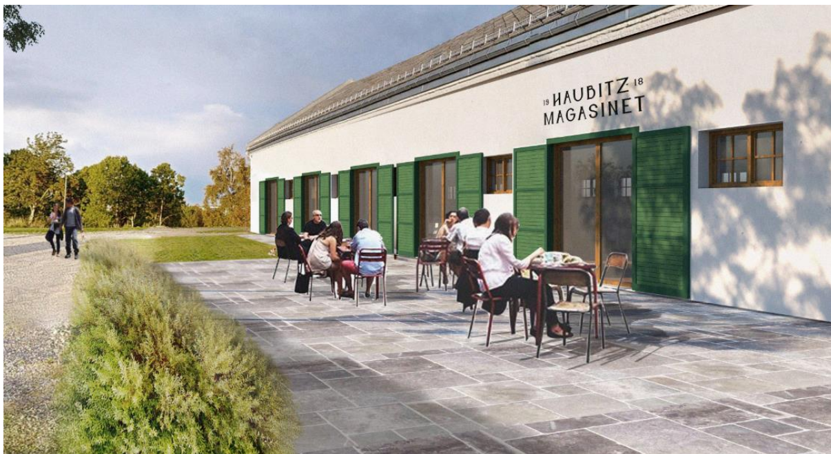
Illustrasjon hentet fra mulighetsstudien som viser mulig uteservering og åpning av flere glassfelt på fasaden.