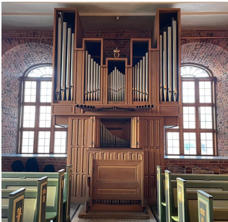
Fig. 3 Orgelet fra 1967 i slottskirken på Akershus. Fasaden er funksjonell og symmetrisk, slik fasader ofte ble utformet på 1960- og 1970-tallet. Fasadepipene tilhører Principal 4' og er klingende. Som mange orgler på denne tiden fikk orgelet spansk trompet-stemme med horisontale lydbegre som stikker ut fra fasaden. Brystverket ble ofte utstyrt med svelluker som her.

Det nye orgelet i slottskirken ble stilt opp på golvet mellom to vinduer bakerst i kirken, og karakteristisk nok ble orgelet hovedverk eller 1. manual basert på Principal 4'. Orgelet ble innviet den 6. juli 1967, 17 og ble den gang betraktet som et godt instrument. Det tok seg dessuten flott ut med sin høyreiste og symmetriske fasade med kongemonogrammet på toppen av midtre pipefelt. Orgelbyggeriet leverte et instrument av utsøkt snekkerkvalitet, men klanglig sett manglet det fundament og gravitet.