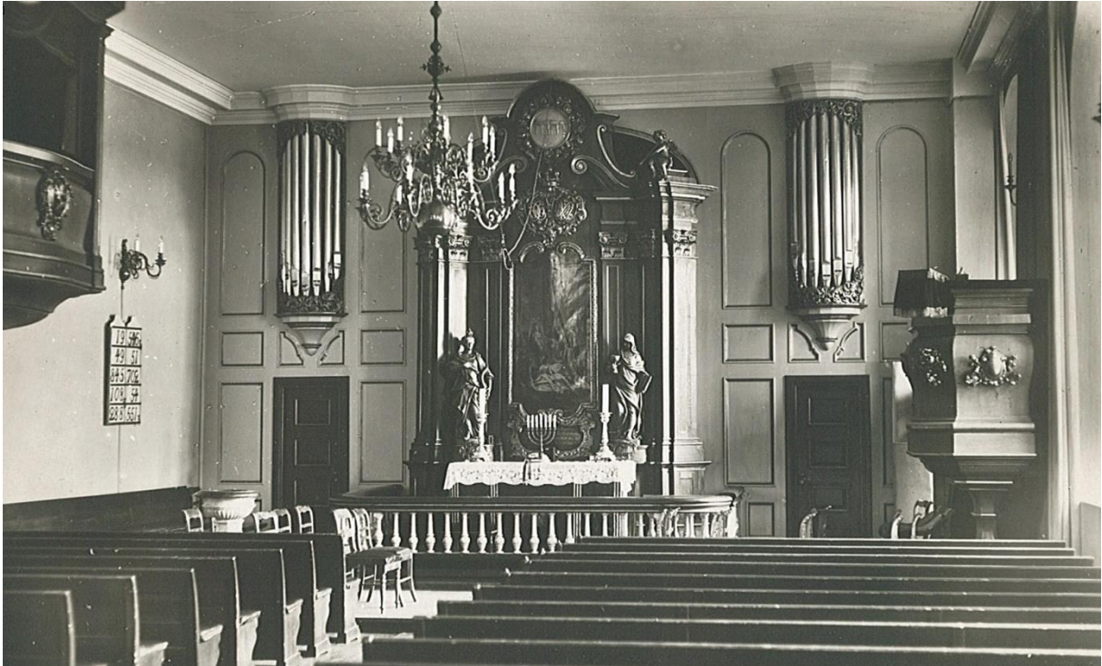
Fig. 2 Slottskirkens fondvegg med lydåpningene til orgelet dekket av attrappiper av orgelmetall, dekorert og stilt opp på rokokko-manér slik Sinding–Larsen utformet veggen. Kongestolen oppe til venstre har nå fått rokokko-utforming slik alterparti og prekestol fikk i 1738 – 1741. «Orgelprospektet» er tilpasset denne stilen selv om orgelet klanglig sett tilhørte en annen tid. Foto: Ukjent fotograf/Abels kunstforlag ca. 1930, byhistorisk samling, Oslo bymuseum, inventarnr. OB. F11855d.

den måten representerte en ny tid som var i emning: postromantikken . Et kjennetegn for postromantisk orgelbygging er blant andre de store symfoniske orglene som skulle være i stand til å gjengi en så stor del av orgelrepertoaret som mulig. Orgelet i slottskirken var ikke stort, men det hadde stemmer som i stor grad favoriserte det romantiske orgelrepertoaret, mens orgelmusikk fra barokk og klassisisme ble formidlet med mindre troverdighet klanglig sett.