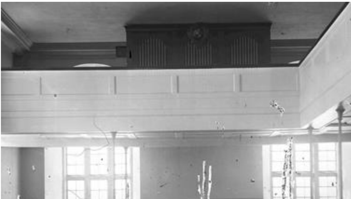
Fig. 1 Albrechtsen-orgelet i slottskirken på Akershus. Orgelet hadde spillebordet på siden og trespiler som illuderer attrapp-piper i fasaden. Takhøyden på galleriet var så lav at Bassoktaven til Principal 8' hadde dekte piper. Foto: Ole Tobias Olsen ca. 1875, Byhistorisk samling, Oslo museum

Orgelet var i bruk i slottskirken helt fram til 1917. Da ble det solgt til Storekalsøy kirke i Austevoll kommune. Det brente med kirken i 1974.