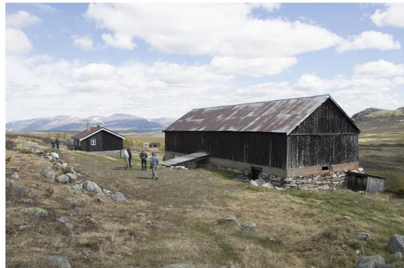
Vesliesetrene på Dovrefjell er stridens kjerne. Staten vil rive dem, mens lokalbefolkningen og kulturforkjempere vil la dem stå, og varst demonstrasjoner.

Oppdal Sp kaster seg inn i debatten om skytefeltet.