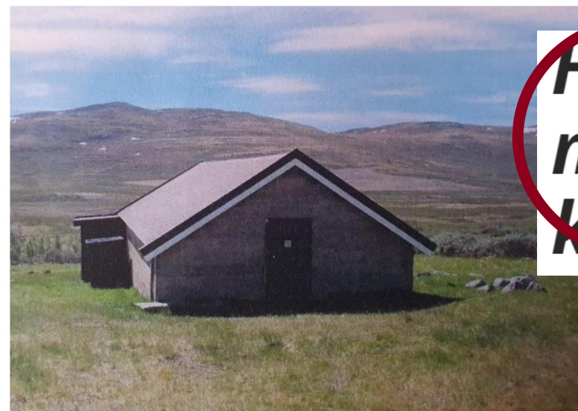
BORTE: En av bygningene på Bentdalssetra som nå er revet.