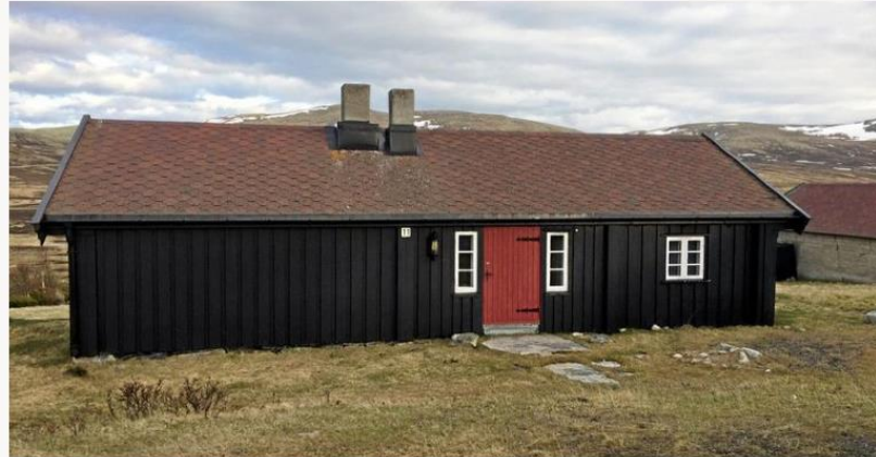
Ullik: Seterdrifta i Vesleie (bildet) og turisthyttedrifta på Snaheim tok slutt på 50-tallet. Turisthytta er igjen i drift - setra skal rives

Riving av to setergrender på Hjerkin vil være et uhistorisk og uproporsjonalt feilgrep.