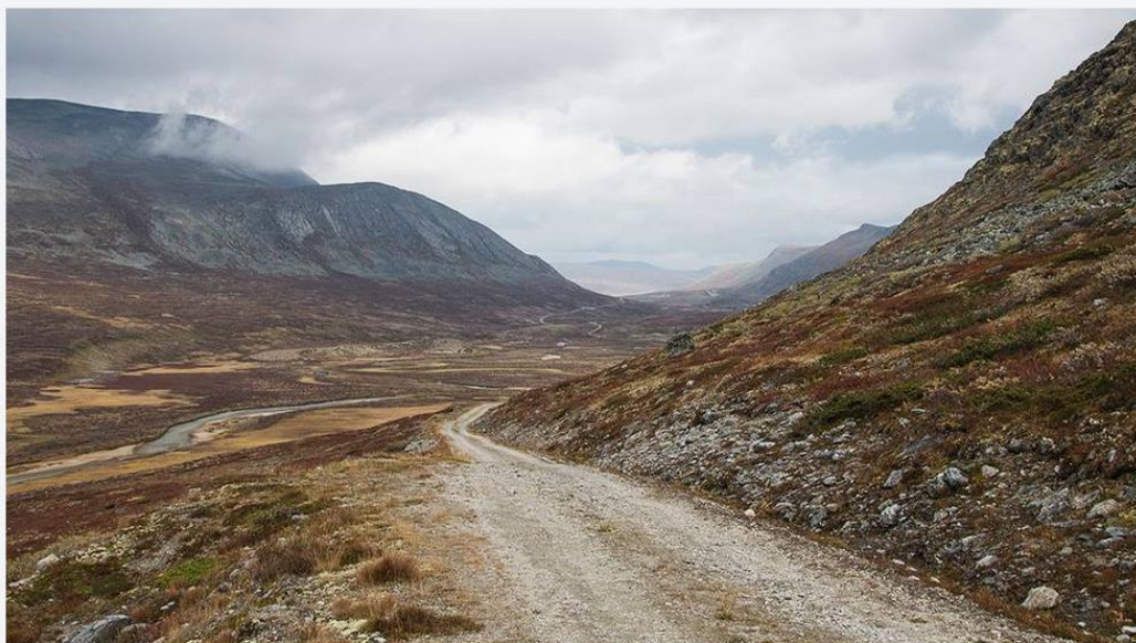
Området som omfatter ringvegen gjennom Grøndalen i Lesja kommune er avsatt til å være LNF-område i Lesja arealplan. Lesja kommune har avslått søknaden om å fjerne vegen i forbindelse med restaureringen av Hjerkins skytefelt.

Lesja kommune gir ikke tillatelse til fjerning av veg i det tidligere skytefeltet.